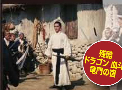
残酷 ドラゴン 血斗 竜門の宿