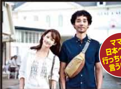
ママは 日本へ嫁に 行っちゃダメと 言うけれど